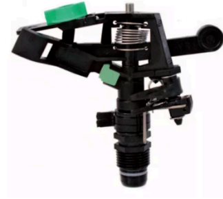
Aspersor de impacto regulable.