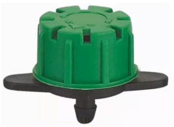
Goteros de caudal regulable.