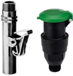
Válvula y estaca para aspersor de impacto.